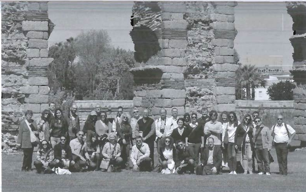
Merida - Docenti e studenti al viaggio di studio in Spagna e Portogallo