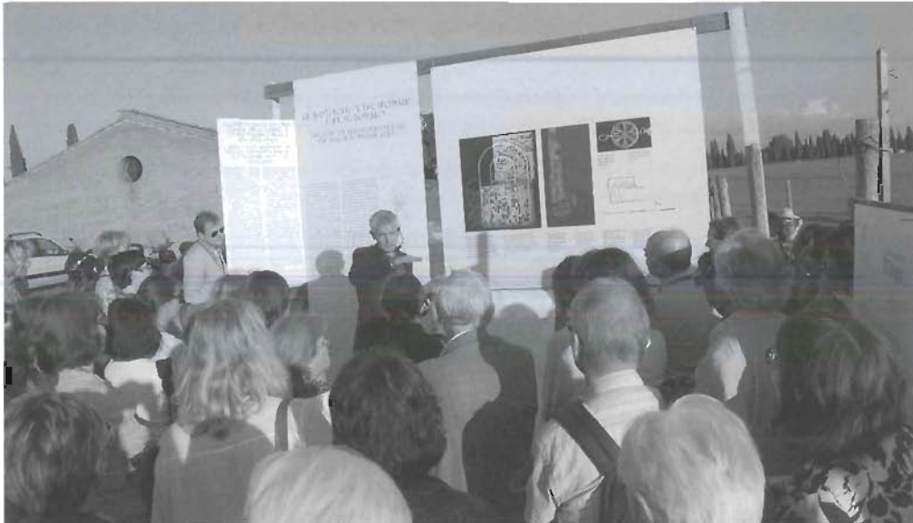
Visita congressuale alla basilica circiforme della via Ardeatina

Il Pontificio Istituto di Archeologia Cristiana ha organizzato a Roma il XVI Congresso Internazionale di Archeologia Cristiana dal tema "Costantino e i Costantinidi: L'innovazione costantiniana, le sue radici e i suoi sviluppi", che si è celebrato dal 22 al 28 settembre 2013 presso l'aula magna dell'Istituto Patristico Augustinianum .