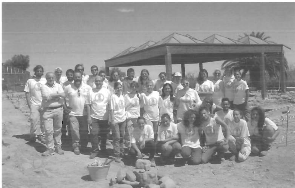
Riva Ligure - Il gruppo con le magliette del PIAC