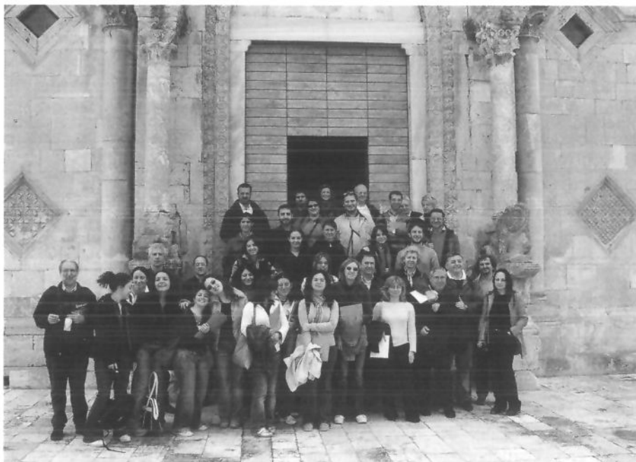
24-30 aprile 2006 - I partecipanti al viaggio di studio davanti alla chiesa di Santa Maria di Siponto.

Il 26 maggio sono terminate le lezioni dell'Anno Accademico 2005-2006.